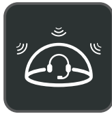
Technologie Acoustic Shield