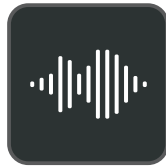
Expérience audio Optima