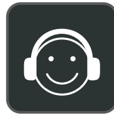
Utilisation confortable tout au long de la journée