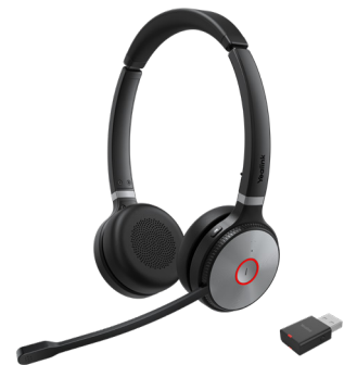
WH62 Dual Portable Teams WH62 Dual Portable UC

Sur la base de centaines d'évaluations de forme de visage et de milliers de tests de confort d'utilisation, le WH62 répond Portable largement aux exigences ergonomiques. En outre, avec ses coussins en cuir souple de qualité et sa conception légère, vous pouvez le porter confortablement toute la journée. Pour une plus grande liberté d'espace de travail, le WH62 peut également vous permettre de vous éloigner jusqu'à 120 m du bureau.