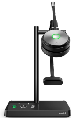
WH62 Mono Teams WH62 Mono UC