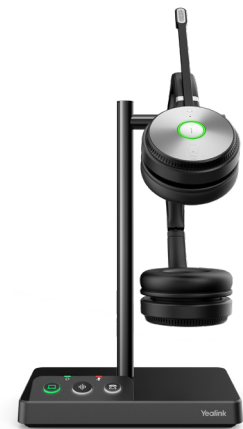
WH62 Dual Teams WH62 Dual UC